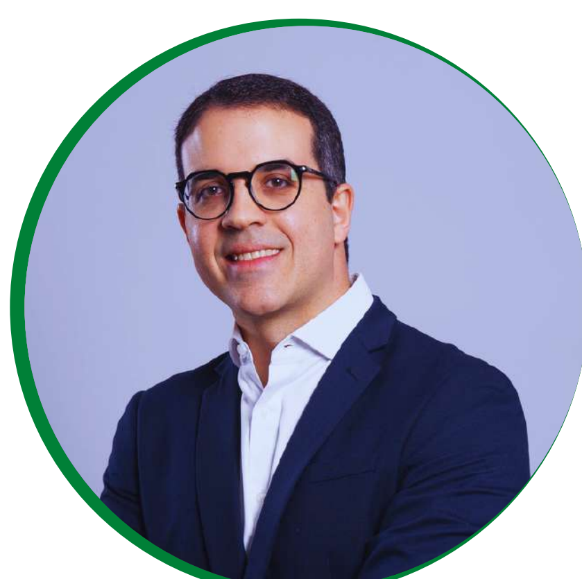
Danilo Almeida Procurador de Estado