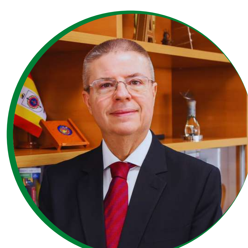
Antonio Anastasia Ministro do TCU