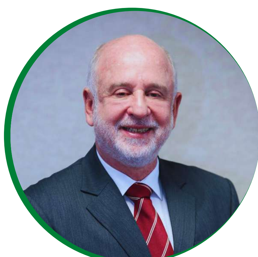
Benjamin Zymler Ministro do TCU